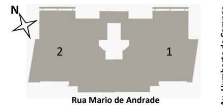
Tabela sujeita a alteração sem aviso prévio.